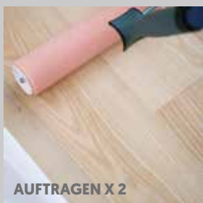
AUFTRAGEN X 2

Wöchentliche Reinigung: Master Cleaner, #684525 Halbjährliche Pflege: Master Care, #684125